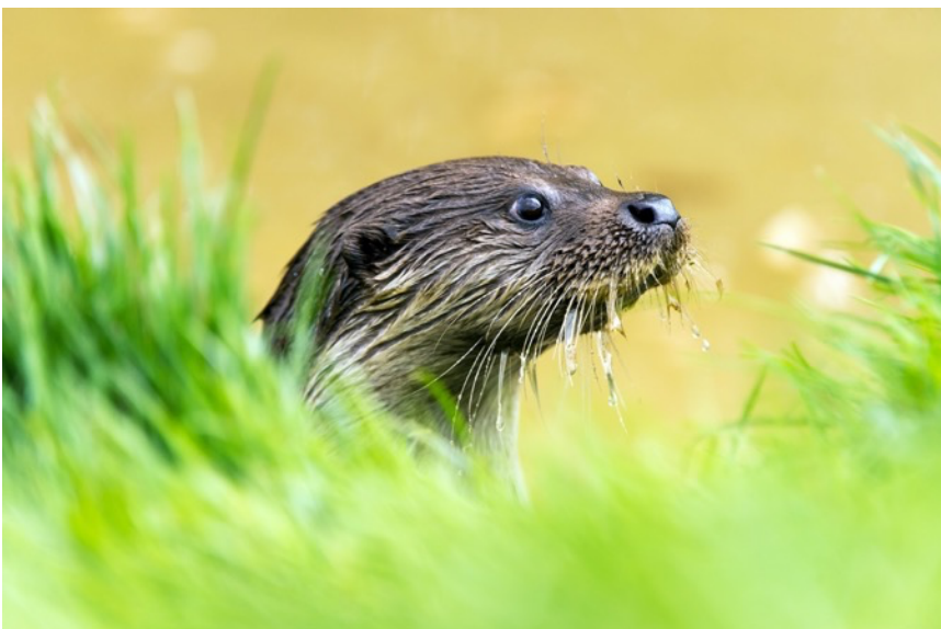
Afbeelding: De otter heeft schoon water nodig om in waterschap AGV te kunnen leven

Energie en grondstoffen als fosfaat en cellulose winnen we maximaal terug uit het rioolwater. Zo zorgen wij ervoor dat het waterschap niet bijdraagt aan verdere watervervuiling. We zetten daarbij ook in op het aanpakken van vervuiling door microplastics, medicijnresten en PFAS. Met steeds warme zomers is het immers nog belangrijk dat iedereen in de buurt veilig en schoon zwemwater heeft om verkoeling te vinden.